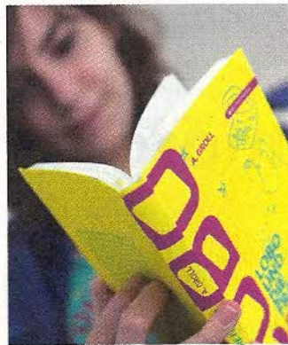
DAS BUCH | Erhältlich im echo-media buchverlag um € 17,70 im (Online-)Buchhandel.

duktives zu tun, während die anderen im Bad nur herumgesehen sind.“ Einem Leben nur als Autor steht er skeptisch gegenüber: „Von Büchern zu leben ist sicher nicht einfach. Man kann nichts erzwingen. Ich schreibe, weil es mir Spaß macht.“ Er arbeitet auch schon an seinem zweiten Buch. Das Wetter hierfür passt jedenfalls! www.lobounddiefrauen.com